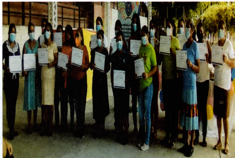
Madres y padres recibiendo su diploma de participación del curso básico de Derechos Humanos

Para la Asociación es muy importante que nuestros afiliados participen de estos cursos que les permitirá exigir el cumplimiento de sus derechos y los derechos de sus hijos e hijas.