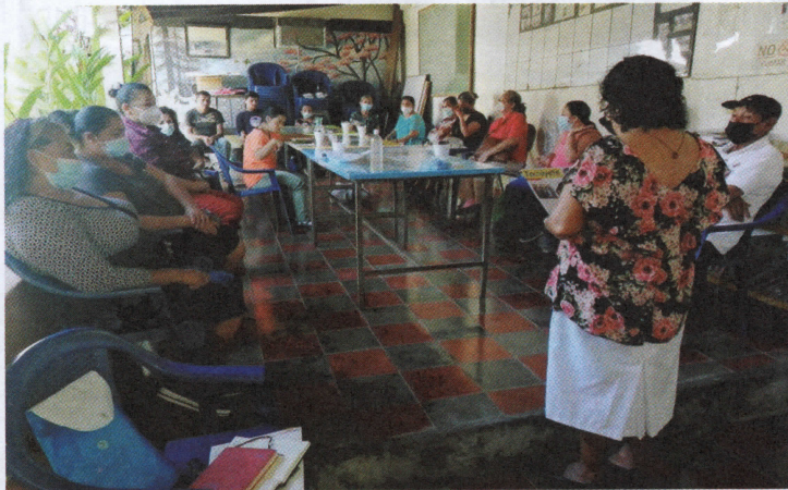
Asamblea de afiliados/as en Suchitoto, Cuscatlán