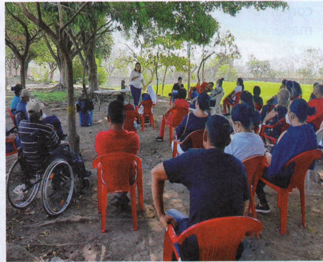
Asamblea de afiliados/as en Tecoluca, San Vicente

Las Directivas Locales de Padres, Madres y Familiares afiliados en los departamentos de Cuscatlán, Cabañas y San Vicente, dieron inicio en el mes de febrero las primeras Asambleas Trimestrales del año, con el propósito de informar a los afiliados y afiliadas las actividades realizadas desde el 11 de diciembre que se desarrolló la Asamblea Nacional de Delegados hasta la fecha, así como también, las proyecciones de trabajo en las áreas de: organización, incidencia política/pública, atención directa e Inclusión social. Estas Asambleas, se continuarán realizando cada tres meses en todos los departamentos en los cuales la Asociación tiene trabajo, por lo cual motivamos a todos nuestros afiliados y afiliados/as a participar activamente en las asambleas, ya que estos son espacios que promueven la comunicación, el debate y la formulación de propuestas que contribuyen a la rehabilitación y el cumplimiento de los derechos de sus hijos e hijas con discapacidad.