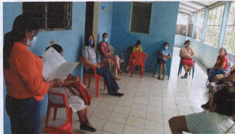
Asamblea de afiliados/as en San Francisco Echeverría, Cabañas