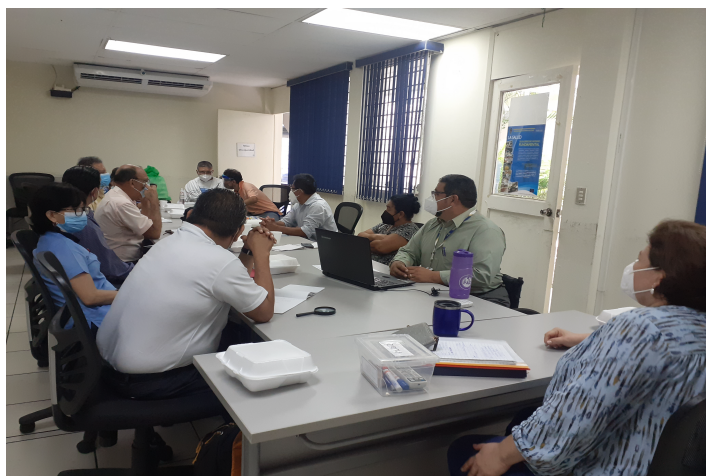
Reuniones de la Mesa Permanente de la PDDH