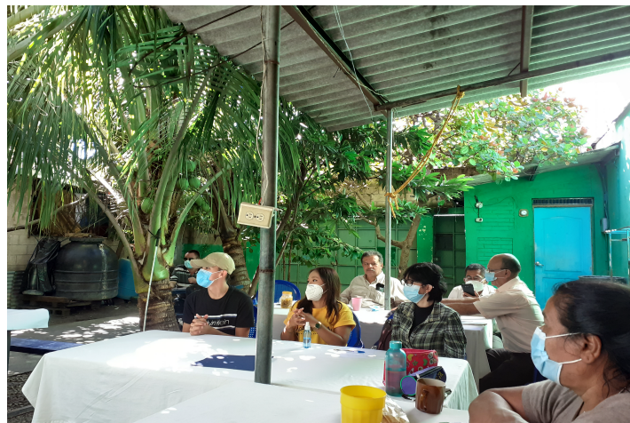
Talleres formativos de las Organizaciones